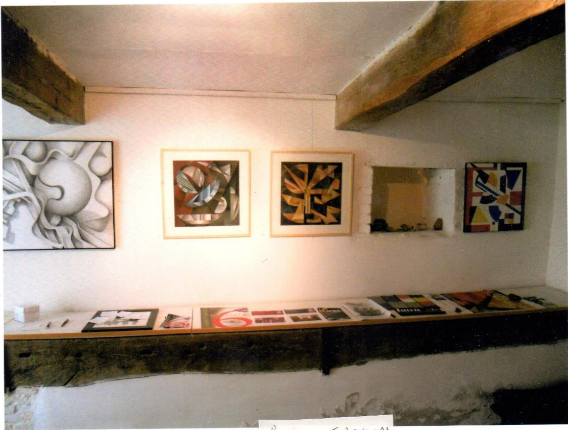
Geared TACKON Suva, Suva Oct 2012