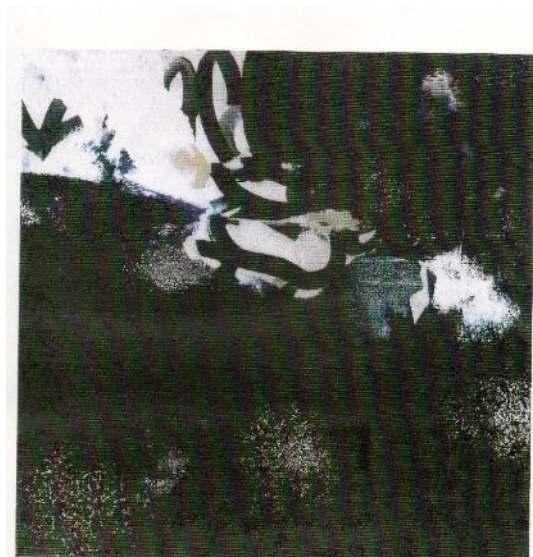
« Matière noire » n°9 - 2002 – Encre et huile sur papier collé sur toile. 120 cm x 120 cm