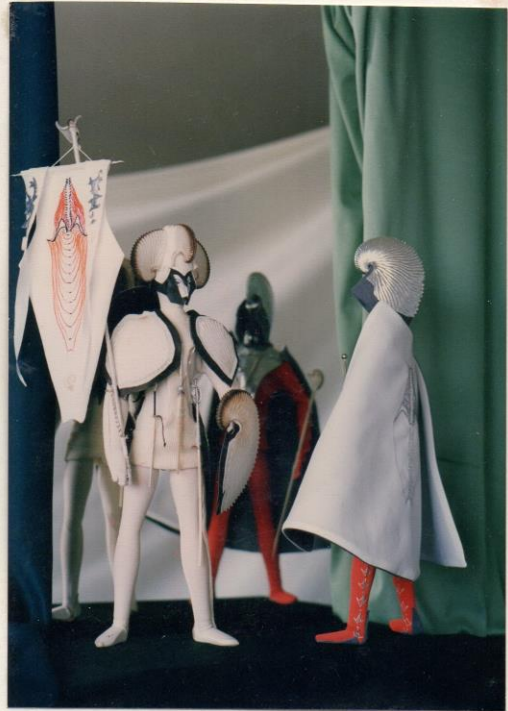
Jezn TUR 1992