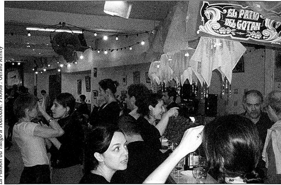
La Maison du Tango à Toulouse.