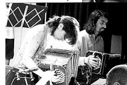
...Salle de Pompertuzat, le 5 novembre 2005...