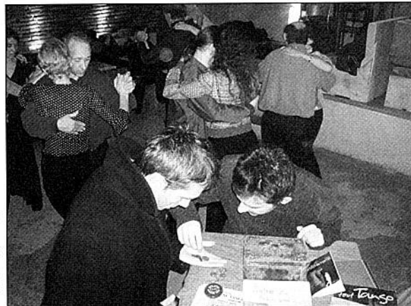
Le Friendly Café

L'horaire 18-23h imposé par la MJC Croix Daurade , de contrainte est devenu un atout. La qualité des choix en vivo et aux platines a fait le reste.