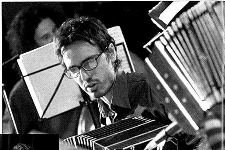
Concert de La Tipica Imperial à Toulouse...